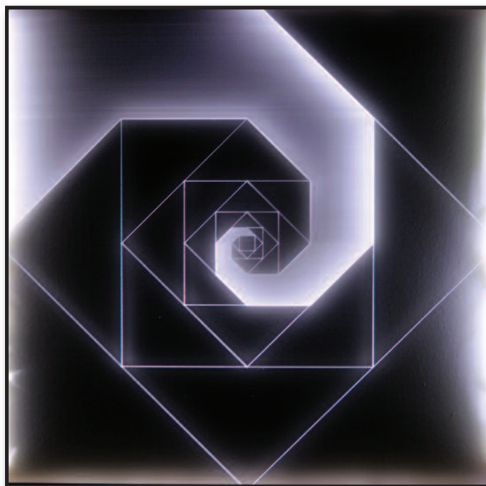
"Spirale aurea quadrato" - 2016 - tecnica mista e led

Con la realizzazione del ciclo dei Sipari l'indagine prosegue su fenomeni direttamente collegati alla teoria del colore e alla complementarità cromatica. Oggi la sua ricerca approda all'unione di tutti gli studi precedentemente svolti in un ciclo di opere che unisce il minimalismo che tanto l'affascina agli approfondimenti di origine orientale, trasportando e incidendo il tutto su plexiglass.