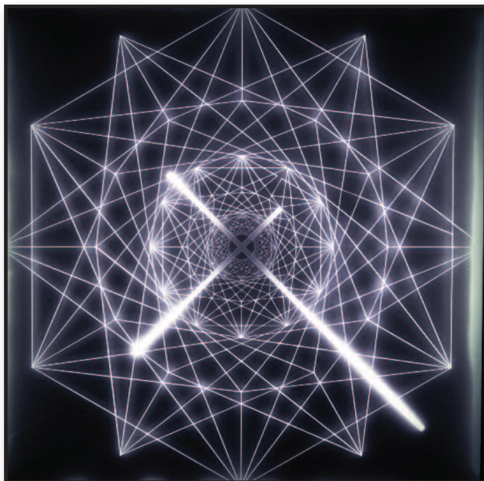
"Costellazione aurea" - 2016 - tecnica mista e led