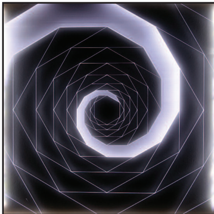
"Spirale aurea esagono" - 2016 - tecnica mista e led